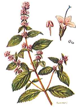
PLATE VII.— Mentha piperita . The source of Oil of Peppermint Piperina (piperonal) etc.: From Jackson: Practical Pharmacology and Materia Medica .

In onze kruidenlijst komen nogal wat kruiden voor waarmee thee kan gezet worden. Onder andere bij de munten zijn er enkele die uitstekend geschikt zijn om een "theetje" te maken.