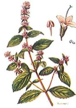
PLATE VII.— Mentha piperita . The roots of Mentha piperita (Pepermunt) etc. from Botanica , Repositorium pharmacologicum et Medicum (Linnæus).

In onze kruidenlijst komen nogal wat kruiden voor waarmee thee kan gezet worden. Onder andere bij de munten zijn er enkele die uitstekend geschikt zijn om een "theetje" te maken.