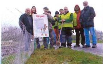
Jaarlijkse paddenoverzetactie met steun van het Stadslandschap 't West-Vlaamse hart

IZEGEM - Afgelopen zaterdag was het weer een hoogdag voor de Izegemse natuurleefhebbers. Onze stad kreeg er namelijk een insectentoren bij, iedereen die nieuwsgierig is en iets wil bijleren, kan er vanaf nu zijn hartje opmaken. De insectentoren is een unieke plek waar de kinderen van de Izegemse basisscholen hun eigen insectentoren kunnen bouwen. Dit is een geweldige manier om de kinderen te laten ontdekken hoe belangrijk insecten zijn voor de natuur. Tuinstuifdeling Verkeerswacht en openbare werken van de stad Izegem zijn verantwoordelijk voor de aanleg van de insectentoren. Het is een mooi voorbeeld van samenwerking tussen de stad en de natuurleefhebbers.