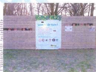
Vogels voeren en beloeren aan de Krekel (Izegem)