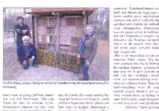
2012 - Wilde bijen krijgen luxueus hotel nabij Izegems sportcomplex, de Krekel

IZEGEM - Afgelopen zaterdag was het weer een hoogdag voor de Izegemse natuurleefhebbers. Onze stad kreeg er namelijk een insectentoren bij, iedereen die nieuwsgierig is en iets wil bijleren, kan er vanaf nu zijn hartje opmaken. De insectentoren is een unieke plek waar de kinderen van de Izegemse basisscholen hun eigen insectentoren kunnen bouwen. Dit is een geweldige manier om de kinderen te laten ontdekken hoe belangrijk insecten zijn voor de natuur. Tuinstuifdeling Verkeerswacht en openbare werken van de stad Izegem zijn verantwoordelijk voor de aanleg van de insectentoren. Het is een mooi voorbeeld van samenwerking tussen de stad en de natuurleefhebbers.