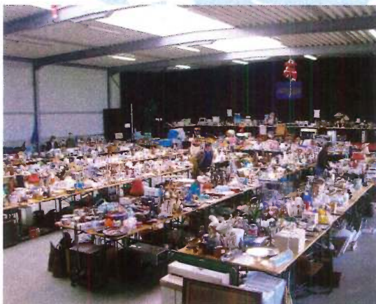
Jaarlijkse rommelmarkt - we geven uw spullen een tweede leven (Ingelmunster)