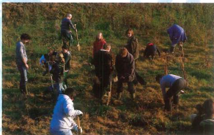
Dag van de Natuur 2011 - Aanplantingen rond het bufferbekken aan de Bossebeek (Izegem)

Insecten spotten in insectentoren in Izegem