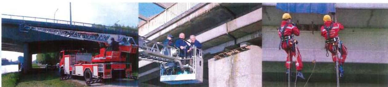
Plaatsen van zwaluwkunsten aan verschillende bruggen over het kanaal, met de hulp van de brandweerkorpsen van Izegem en Ingelmunster