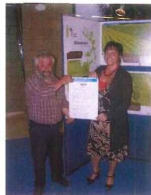
2010 - Natuurpunt De Buizerd en Izegems Stadsbestuur ondertekenen biodiversiteitscharter